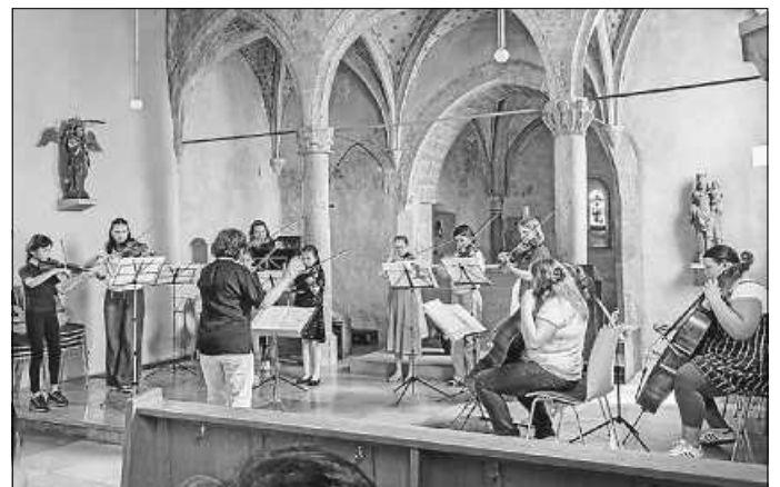
Konzert auf dem Michaelsberg

Beim Streicherwochenende auf dem Michaelsberg wurde viel ge- probt, gelacht, gespielt und der ein oder andere Streich verübt.