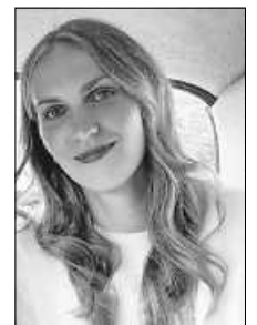
Mika Schäfer

Beim Streicherwochenende auf dem Michaelsberg wurde viel ge- probt, gelacht, gespielt und der ein oder andere Streich verübt.