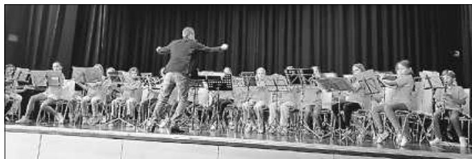
Abschlusskonzert der Bläserklassen